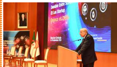
JOURNÉE DE RENCONTRE ENTRE SONATRACH ET LES START-UPS DU SECTEUR DE L'ÉNERGIE

CEREMONIE DE GRATIFICATION DES BACHELIERS LAUREATS DE LA SESSION 2024 ..... P54