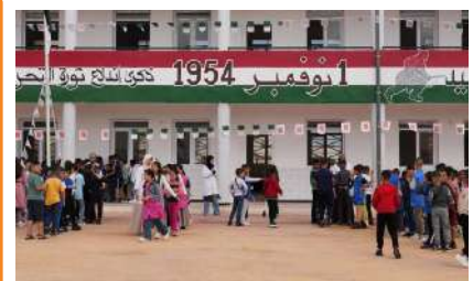
INVESTISSEMENT SOCIAL EN FAVEUR DU SECTEUR DE L'EDUCATION