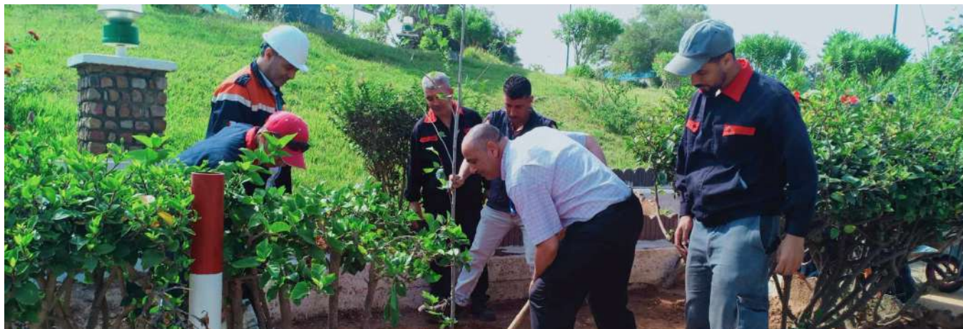
« CELUI QUI PLANTE UN ARBRE PLANTE UN ESPOIR »

S ONATRACH a célébré, le 5 juin 2024, la Journée mondiale de l'Environnement, placée cette année sous le thème de «La restauration des terres, la désertification et la résilience face à la sécheresse». Le choix de cette thématique n'est pas fortuit, il interpelle tout un chacun sur l'urgence d'agir pour assurer un avenir durable pour les générations futures