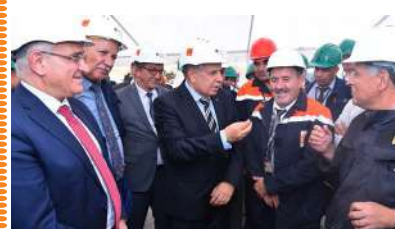
VISITE DE TRAVAIL DU PDG DE SONATRACH DANS L'OUEST DU PAYS