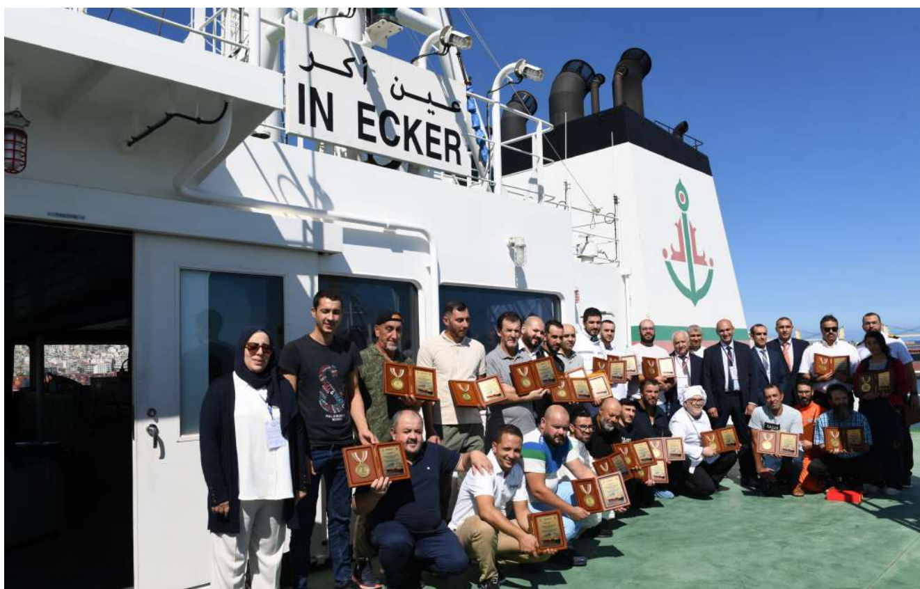
L'équipage de In Ecker honoré lors de leur accostage au port pétrolier d'Alger par les responsables du Groupe SONATRACH

Le Ministre libanais de l'Energie et de l'Eau, le Docteur Walid FAYAD, a salué ce don de solidarité, exprimant ses remerciements au Président de la République, M. Abdelmadjid TEBBOUNE, et au Peuple Algérien pour cette initiative solidaire.