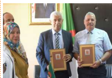
SONATRACH RENOUVELLE SA CONVENTION CADRE AVEC LE MINISTRE DE L'ENSEIGNEMENT SUPERIEUR E