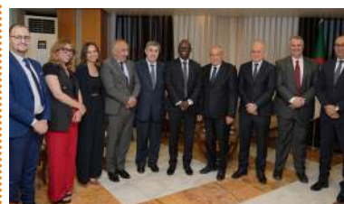
VISITE DU VICE-PRESIDENT DE LA BANQUE MONDIALE A SONATRACH

JOURNÉE DE RENCONTRE ENTRE SONATRACH ET LES START-UPS DU SECTEUR DE L'ÉNERGIE ..... P32