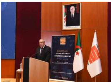
JOURNEE DE SENSIBILISATION AUTOUR DES MENACES CYBERNETIQUES