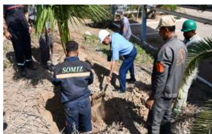
« CELUI QUI PLANTE UN ARBRE PLANTE UN ESPOIR »