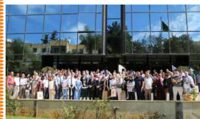
CEREMONIE DE GRATIFICATION DES BACHELIERS LAUREATS DE LA SESSION 2024