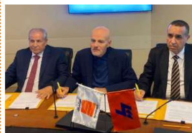
AVEC LA COMPAGNIE ITALIENNE ENI.S.P.A