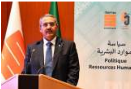
M. Toufik HAKKAR PDG de SONATRACH

Pour clôturer cette rencontre, après un riche débat, les Premiers Responsables des Holdings et des Filiales ont procédé à la signature symbolique d'un poster d'adhésion aux engagements de la Politique Ressources Humaines, marquant ainsi une volonté collégiale d'adopter des modes modernes de gestion des ressources humaines, basés sur des valeurs pérennes et certaines.