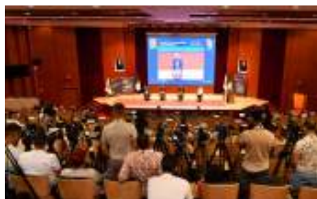
CONFÉRENCE DE PRESSE PRÉSENTATION DU BILAN DES RÉALISATIONS DE SONATRACH POUR L'EXERCICE 2022 ET À FIN MAI 2023 P 6