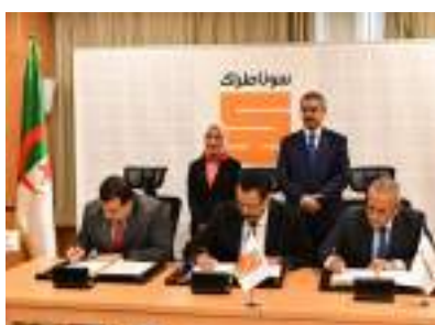
SIGNATURE D'UN NOUVEAU CONTRAT D'HYDROCARBURES ENTRE SONATRACH, PERTAMINA ET REPSOL P 11