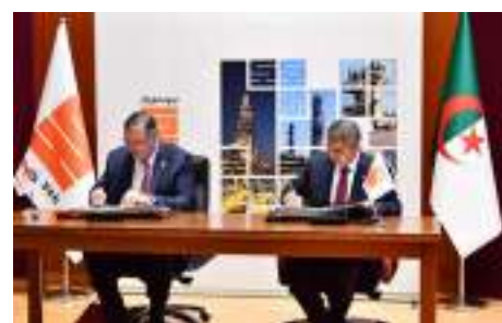
SONATRACH - TOTALENERGIES SIGNATURE DE PLUSIEURS ACCORDS DANS LE DOMAINE DES HYDROCARBURES ET DES ÉNERGIES RENOUVELABLES P 13